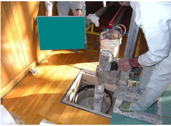
①建物床コンクリートをコア抜き