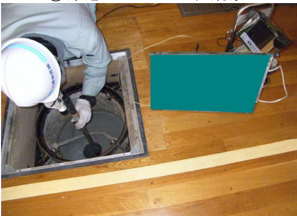
③床底の空洞内測距