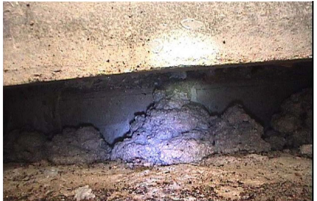
⑤西方向の空洞状況