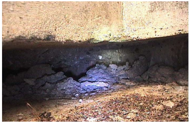
④南方向の空洞状況