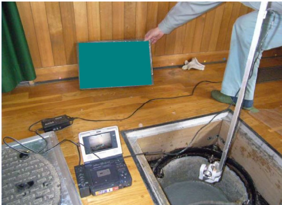
②床底のCCDカメラ観察