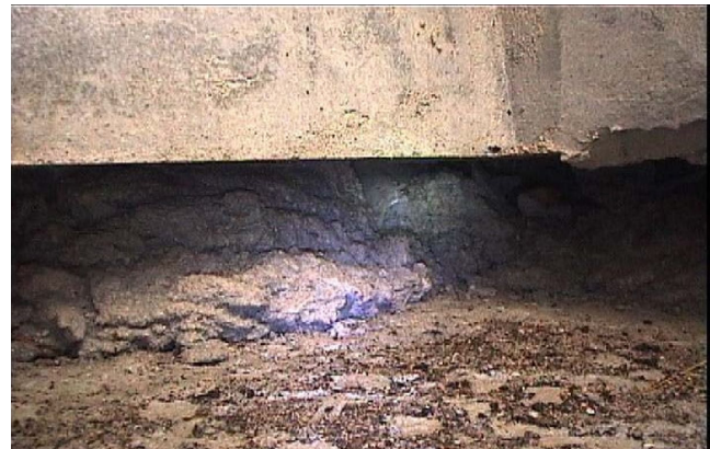
⑥北方向の空洞状況